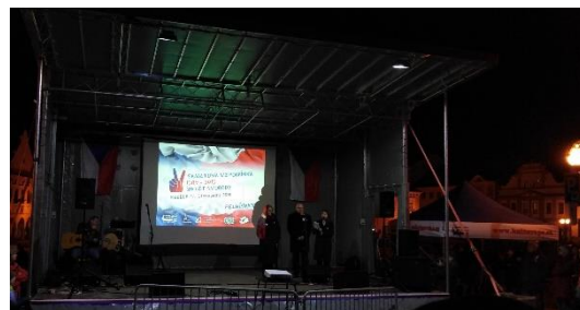
Oslavy výročí na pelhřimovském náměstí

„17. listopadu se slavil den studentů. Právě studenti uctívali památku studenta Jana Opletala