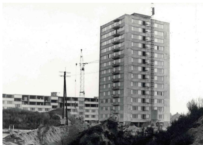
Staveniště okolo věžáku

„Muselo to být někdy během tří let, které jsem zde strávil, takže pravděpodobně v roce 1966. Vedl jsem tehdy architektonický ateliér, který byl součástí Stavoprojektu v Českých Budějovicích.“