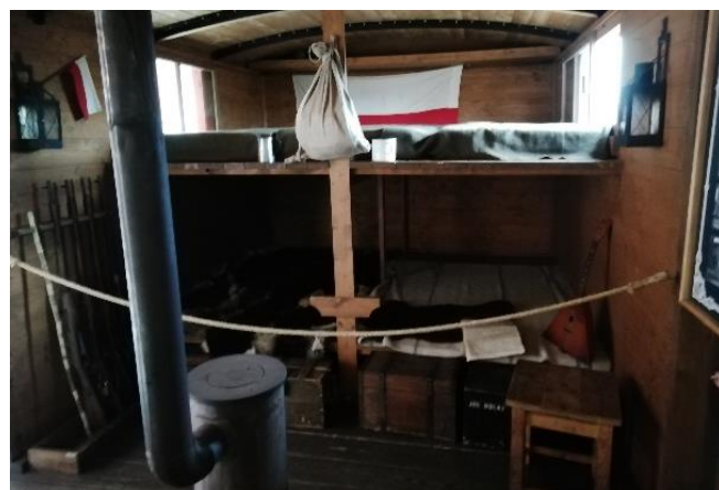
Těpluška – obytný vůz

bude jistě někde k vidění někde jinde, i když ještě není jisté kde. Na internetu je také speciální