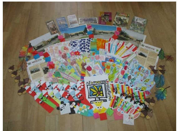
Posíláme na Slovensko