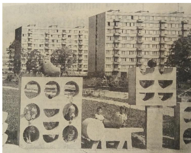
Betonový architektonický prvek na Dolnokubínské

„Museli jsme to tak udělat. I když jsme tajně předělávali dispozice paneláku, tak ty meziokenní vložky jsme tam museli nechat. Přitom, když se dělalo zateplování, asi po roce 1990, tak se většinou vyměňovali, dala se tam vyzdívka anebo se tam dával polystyren. Je pravda, že meziokenní vložky, to bylo nešťastné řešení, ale kvůli omezeným materiálovým možnostem se s tím nedalo nic dělat."