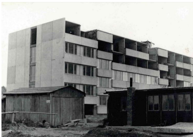
Panelák ve výstavbě. Jsou zde zřetelně vidět panely a meziokenní vložky

poněvadž se dělaly z vlhkého dřeva. Nejdůležitější byl počet, na kvalitě už tak nezáleželo. A okna, která byla v prostředku sklopná, u těch táhlo především okolo čepů, díky kterým se otáčela. Ta okna se častokrát zkroutila tak, že nešla úplně dovřít. Ve Stavoprojektu v Českých Budějovicích, kam jsem poté přešel, jsme měli takováto okna, a když foukal západní vítr a přiložil jsem svíčku k těm místům, vítr skrz to okno tu svíčku zhasnul. Všeobecně kvalita všeho byla špatná."