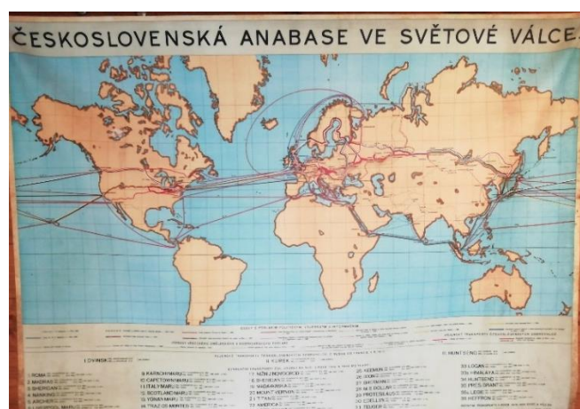
Cesta legionářů domů

mohly dostat domů. Jenže bolševická Rudá armáda jim to nenechala projít jen tak. Nějakou dobu to trvalo, ale nakonec se jich většina dostala domů. Ale to bylo až v roce 1920. Uznání se dlouho nedočkali, protože ani nacisté, ani komunisté nechtěli nikomu vyprávět o tom, že legionáři dobili podstatnou část transsibiřské magistrály a dost dlouho ji drželi.